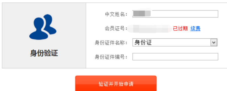
图 4 个人会员过期提示