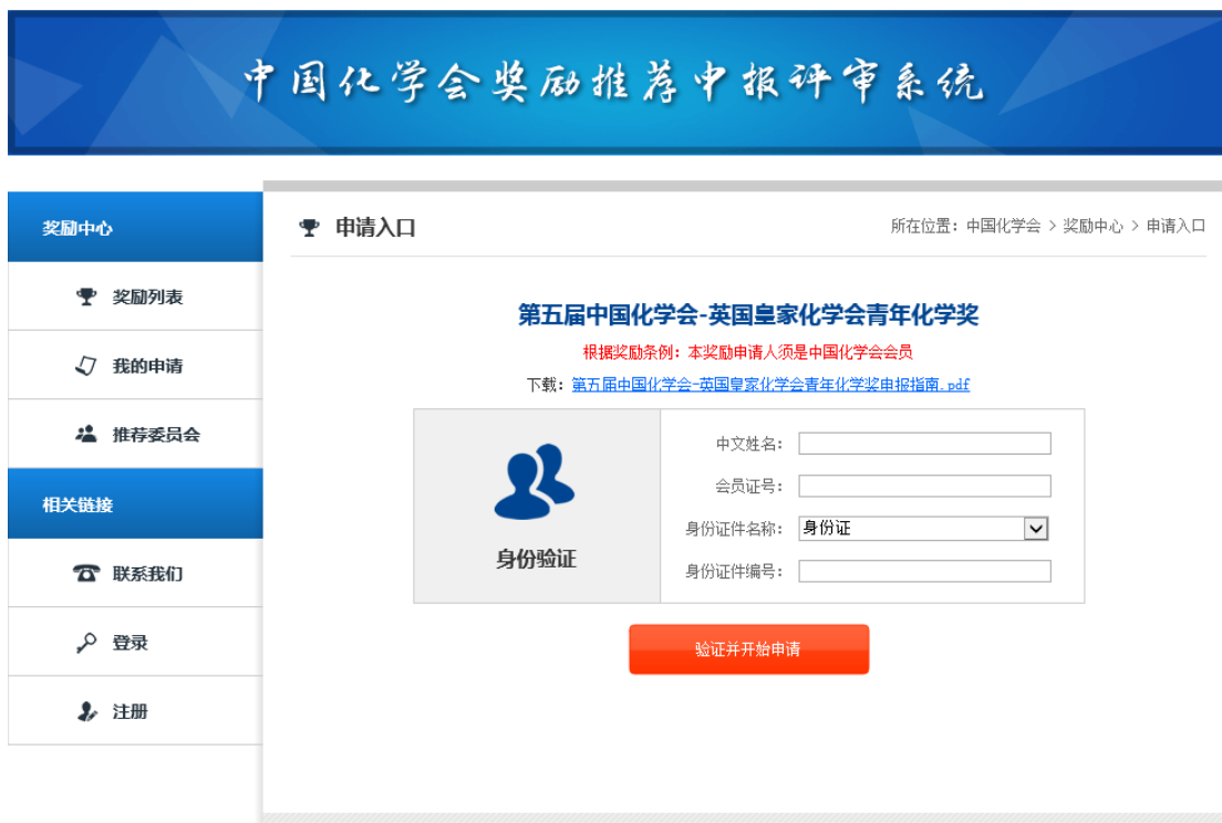
图 2 身份验证页面