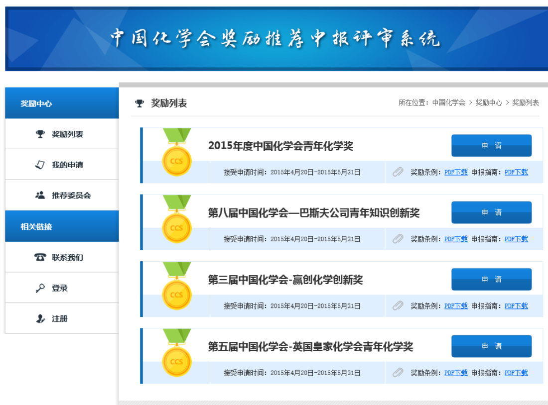
图 1 奖励申报页面

1.2 选择拟申报奖励, 点击下载“奖励条例”和“申报指南”, 仔细阅读并准备好相关材料后, 点击“我要申请”(图 1)。