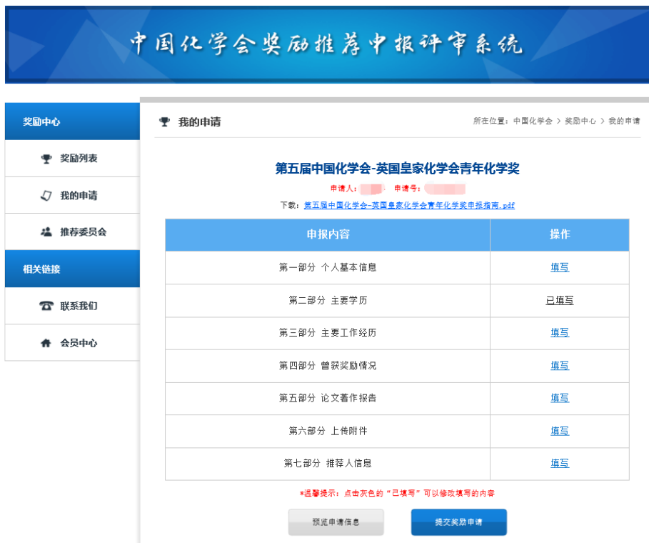
图 8 填写申报内容页面