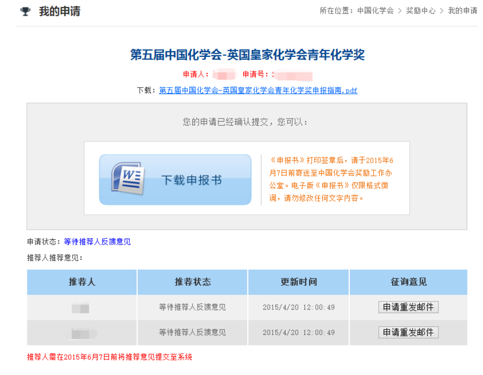
图 9 提交申请成功页面

当提交奖励申请成功后, 页面将自动跳转至“我的申请”, 点击“下载申报书”, 导出申请人的《申报书》DOC 文件 (图 9)。导出后的申报书只可修改格式, 内容需与电子版保持一致。