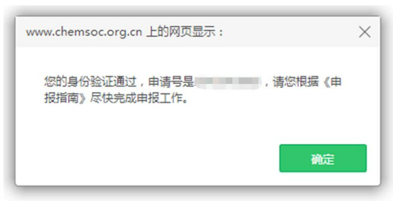
图 3 身份验证成功并获得申请号

如果点击“验证并开始申请”后, 页面显示“已过期续费” (图 4), 表示申请人的会员身份已经过期。可先缴纳会员费, 成为有效个人会员后, 再行申报 (图 5)。