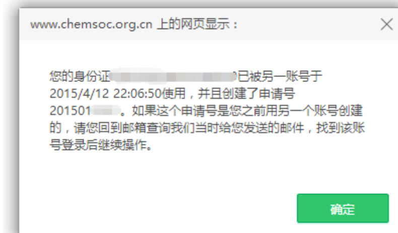
图 7 重复申报奖励提示页面

提示： 非中国化学会会员需先办理入会手续，成为个人会员后，再申报学会奖励。忘记会员证号的申请人可登陆个人会员中心，查看会员证号。如果忘记登录密码，可通过注册时的 Email 和姓名重置密码。