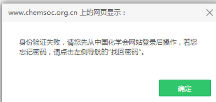
图 6 身份验证失败提示

如果姓名、会员证号等信息输入有误，系统将提示身份验证失败（图 6）。请您确认相关信息后，再次提出申报。