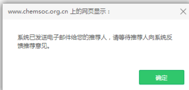
图 17 发信提示页面

当申请人确认提交申报信息后，系统将自动给每位推荐人发送推荐邀请（图 17）。推荐人可根据实际情况同意或拒绝推荐。申请人可以通过“我的申请”查看推荐状态及推荐意见反馈情况。